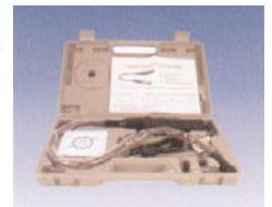
livré avec mallette