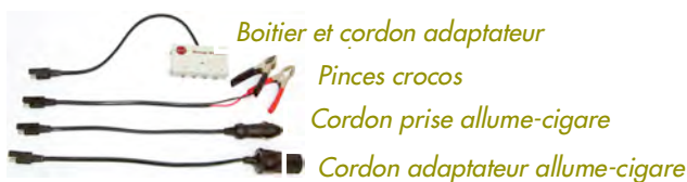
Boîtier et cordon adaptateur